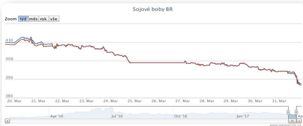
Graf: Sojové boby Brazílie, CIF Rotterdam

Ceny olejnin ukončily poslední březnový týden v červených číslech. Podle odhadu USDA plánují američtí farmáři ve srovnání s loňským rokem osat o 7% více ploch sojovými boby (rekordních 36,2 Mha). Tento očekávaný nárůst, by měl být z velké části na úkor ploch osetých kukuřicí. Na trh s olejninami vytvářeli také tlak zprávy o jihoamerické sklizni, která je v Brazílii z 75% kompletní.